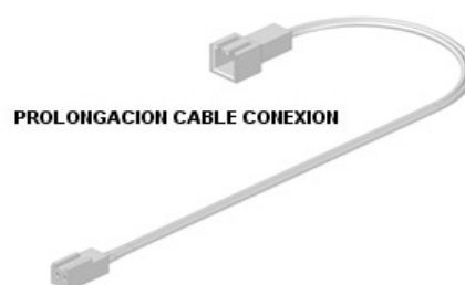
PROLONGACION CABLE CONEXION